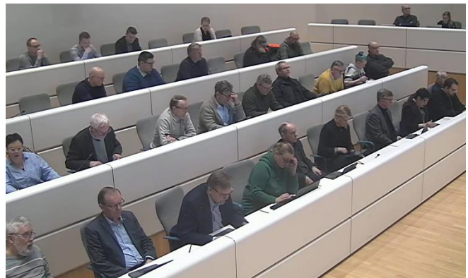
Laitilan kaupunginvaltuustossa on 31 valtuutettua. Äänestämisen kuntavaaleissa on yksi tärkeimmistä tavoista osallistua kunnan kehittämiseen.

Päätöksenteko-osallisuuden keskeinen keino ja kunnan toiminnan kivijalka ovat tietysti kuntavaalit. Niissä valitaan neljän vuoden välein kuntien valtuustoihin valtuutetut käyttämään kuntien ylintä päätösvaltaa. Valtuustossa päätetään esimerkiksi kunnan strategiasta ja talouden toteuttamisesta. Äänestämällä omia arvojaan vastaavaa ehdokasta, kuntalaisella on suora vaikutusmahdollisuus kunnan päätöksentekoon ja siten myös omaan arkeensa vaikuttaviin päätöksiin.