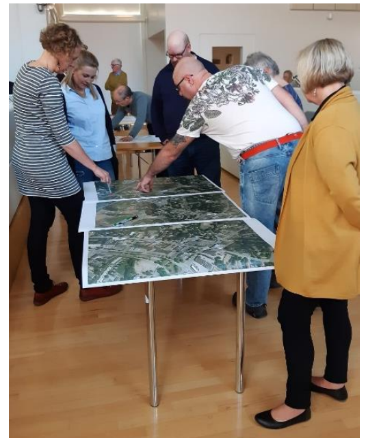
Osallistamiskeinot ovat monien hankkeiden edistämisessä tärkeitä. Esimerkiksi avoimilla työpajoilla voidaan helposti osallistaa kuntalaisia ja sidosryhmiä.

Kunnan asukkaalla, kunnassa toimivalla yhteisöllä ja säätiöllä sekä sillä, joka omistaa tai hallitsee kiinteää omaisuutta kunnassa, on oikeus tehdä aloitteita kunnan toimintaa koskevissa asioissa. Näin todetaan kuntalaisissa ja aloiteoikeus on ollut olemassa vuodesta 1976 asti. Siitä huolimatta aloitteet ovat edelleen vähän käytetty vaikuttamisen muoto kunnassa kautta maan, myös Laitilassa. Laitilan kaupunki on päättänyt vuonna 2024 ottaa käyttöön sähköisen kuntalaisaloite.fi -palvelun, jonka