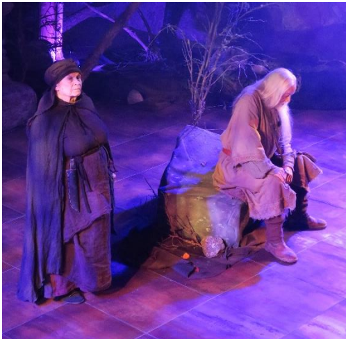
Sivistysvaliokunta on myöntänyt toiminnantukea muun muassa Laitilan Kulttuurin Tuki ry:lle kansanperinteeseen pohjautuvien produktioiden tuottamiseksi.

katsoa säännölliseksi, vähintään kerran kahdessa viikossa järjestettäväksi harrastustoiminnaksi Laitilassa. Perusavustuksen tarkoitus on tukea yhdistyksen toiminnan perusedellytyksiä. Kohdeavustusta voi hakea kulttuuri-, liikunta- ja nuorisotalon uuteen toimintaan, joita voi olla esimerkiksi projekti, tilaisuus tai hankinta, jonka voidaan katsoa lisäävän ja monipuolistavan toimintaa Laitilassa. Lisäksi liikuntatoimen kohdeavustusta voidaan myöntää laitilalaiselle yhdistykselle erityisliikunnan järjestämisen tukemiseen. Kulttuuriavustuksen avustusperusteita ovat