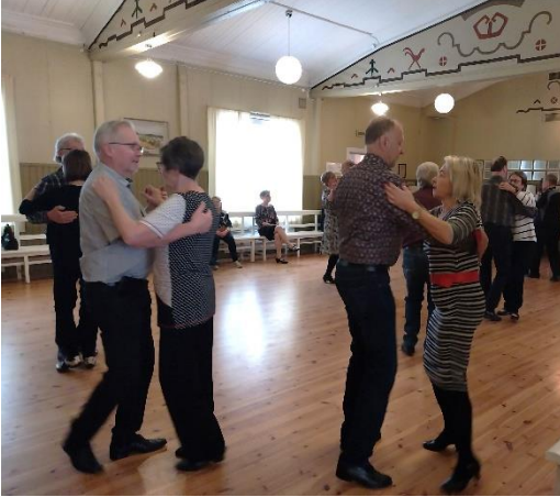
Sujuuko osallistamistyö kuin tanssi? Monesti tärkein palaute saadaan työarjessa ja palvelujen parissa. Esimerkiksi pitämällä korvat auki kuntalaistapahtumien yhteydessä.

Tärkeää kaupunkina on viestiä selkeästi asiakaspalveluajoista ja -paikoista sekä yhteydenottotavoista. Laitilan kokoisessa kaupungissa asiakaspalvelun jatkuva virka-aikaista saavutettavuutta kaikkien toimintojen osalta ei voida taata. Palvelun kriittisyys silti määrittelee myös saavutettavuutta: esimerkiksi vesihuollon päivystys pyritään järjestämään aukottomasti. Saavutettavissa pitäisi joka tapauksessa olla tieto siitä, mihin aikoihin palvelua saa ja minkä kanavien kautta. Nykyisellään sähköposti- ja puhelinpalvelu ovat korvanneet